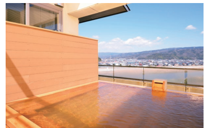
おおとり荘 展望露天風呂