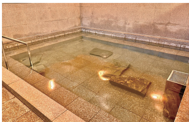
弘法の湯 本店 薬石ラドン浴