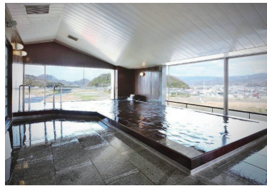
漆塗り 展望大浴場

場所：静岡県伊豆の国市古奈 1133 宿泊チェックイン時間：14:00 TEL：055-948-1095 HP： http://www.o-torisou.jp Instagram：@ootorisou