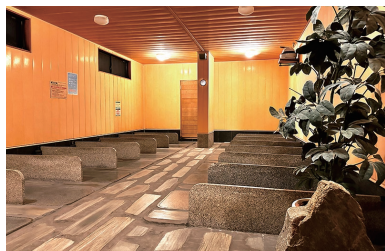
弘法の湯 本店 薬石岩盤浴