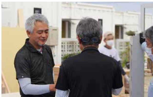
工事中の現場で率先して指揮を取る内宮