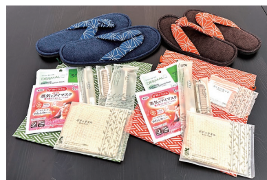
豊富なアメニティ