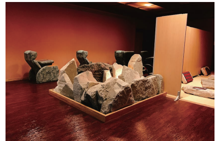
長岡店のストーンセラピールーム