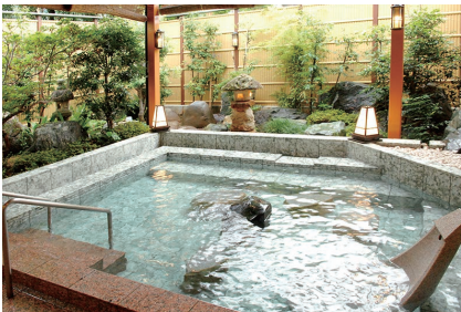
本店の薬石露天風呂