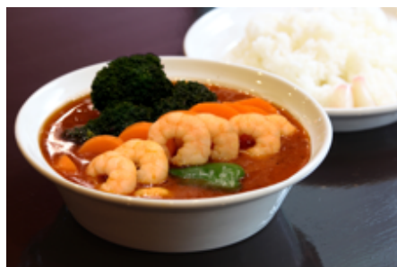
えびカリ (ライス付き) 1,600 円(税込)