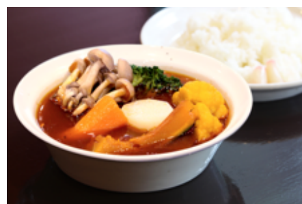
やさいカリ (ライス付き) 1,600 円(税込)

2022 年 7 月にオープン 1 周年を迎えるのを記念し、7 月 21 日(木)～8 月 31 日(水)までスープの量は通常のまま、具材だけ半分の S サイズで、リーズナブルに食べていただける限定メニューを販売します。