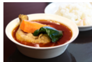
とりカリ S (ライス付き) 990 円 (税込)

2022 年 7 月にオープン 1 周年を迎えるのを記念し、7 月 21 日(木)～8 月 31 日(水)までスープの量は通常のまま、具材だけ半分の S サイズで、リーズナブルに食べていただける限定メニューを販売します。