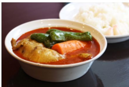
とりカリ (ライス付き) 1,400 円(税込)

札幌に 200 店舗以上あるスープカレー店の中でも、その原型と言われ、札幌スープカレー界ではレジェンド的存在の「アジャンタインドカリ店」の薬膳スープカレーの味とレシピを継承し、本州エリアで唯一元祖スープカレーの味を提供しています。35 種類のスパイスと 10 種類の漢方薬が入ったスープは、味はもちろん、健康や美容にも効果が期待でき、食べ進めると、じんわりと発汗してくるようなマイルドな辛さが特徴です。「アジャンタインドカリ店」のスープカレーの変わらぬ味を提供し続けています。